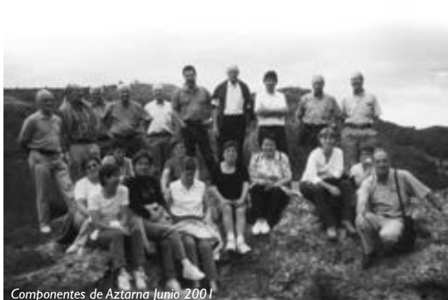
Componentes de Aztarna Junio 2001