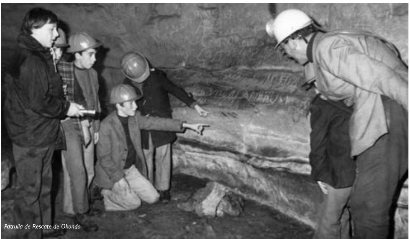
Patrulla de Rescate de Okondo

Sociedad Landazuri Artículo publicado en el periódico El Correo Español (Edición Alava, el 12-11-2001)