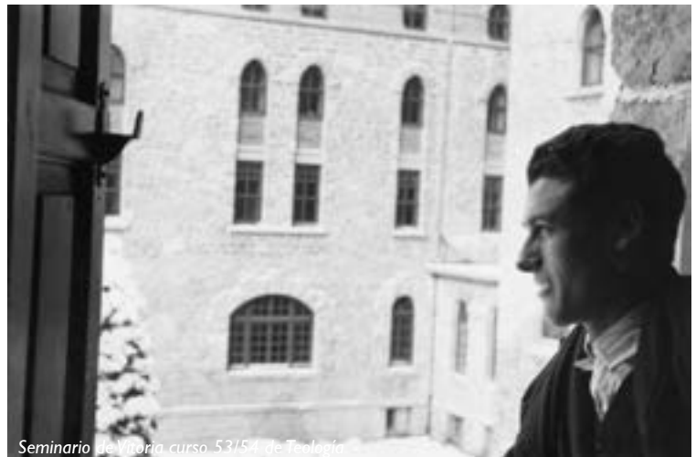
Seminario de Vitoria curso 53/54 de Teología