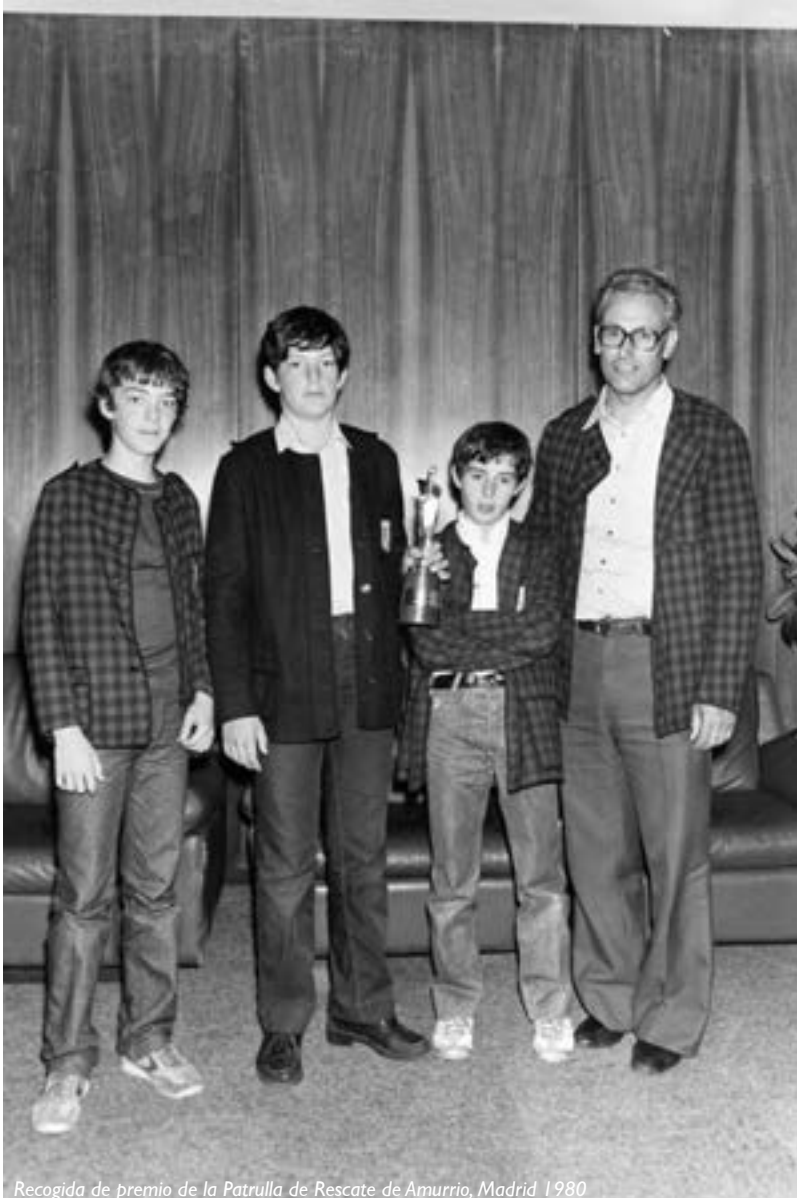
Recogida de premio de la Patrulla de Rescate de Amurrio, Madrid 1980