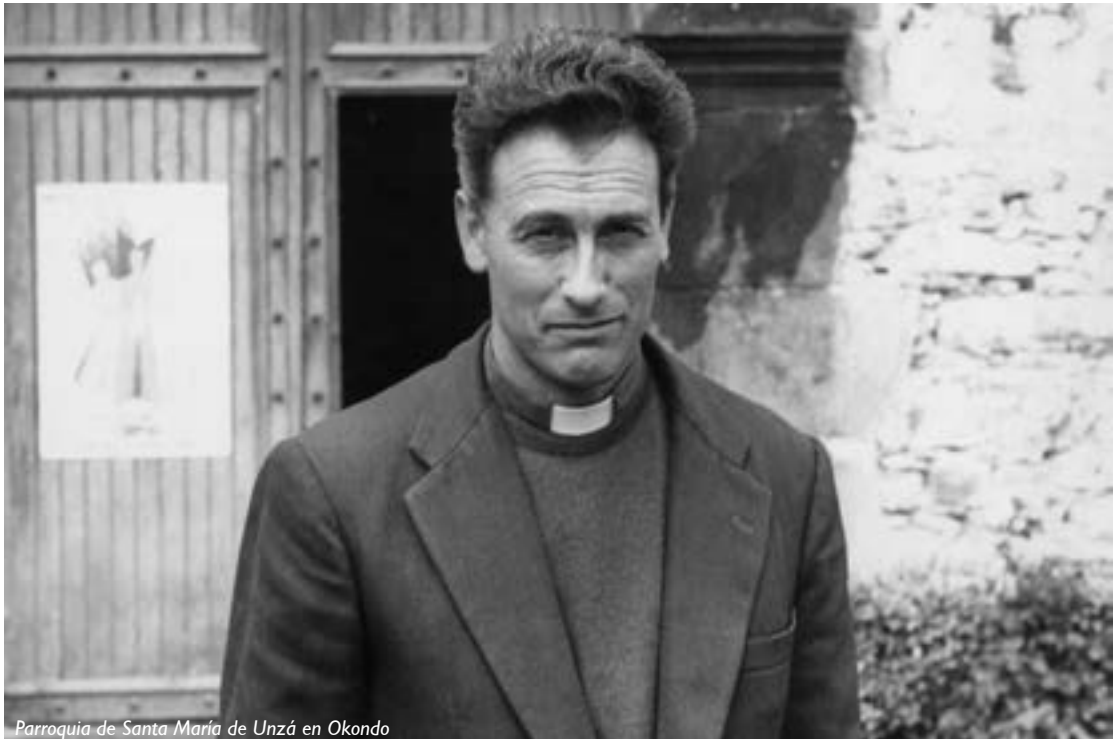
Parroquia de Santa María de Unzá en Okondo

Jóvenes que de su mano pasa por la J.O.C. (Juventud Obrera Cristiana), y ahí queda su semilla.