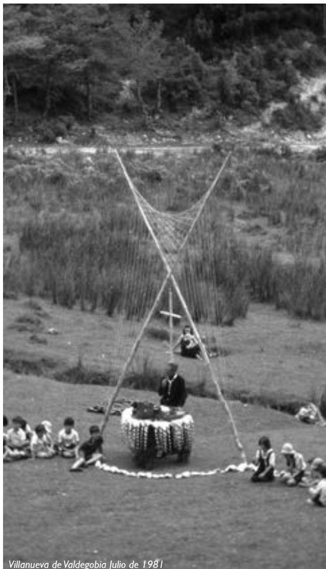
Villanueva de Valdegozia Julio de 1981