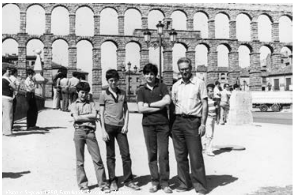
Visita a Segovia 1980, Patrulla de Rescate de Amurrio

Desde aquí nuestro emocionado recuerdo de agradecimiento y cariño hacia él.