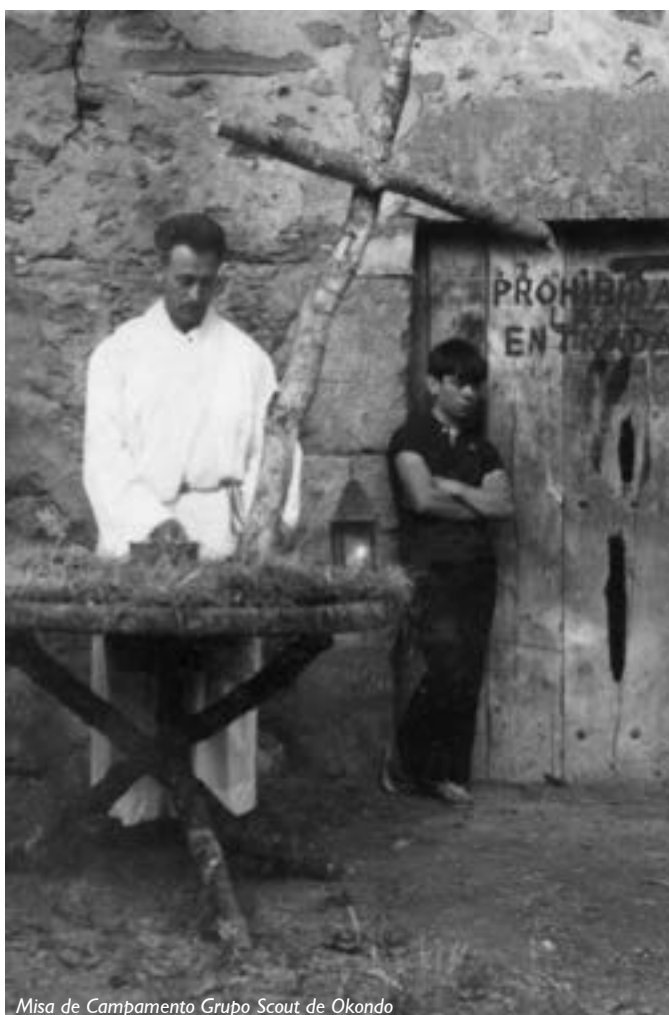
Misa de Campamento Grupo Skout de Okondo

Recuerdo que en las primeras Campañas Electorales acudía a todos los Mítines que se celebraban en