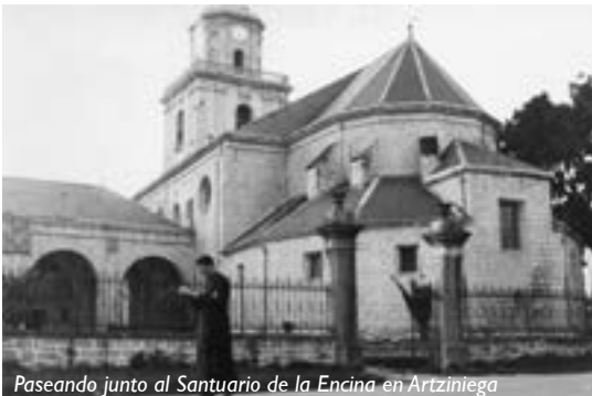
Paseando junto al Santuario de la Encina en Artziniega

10 al 15-11-69 Asistió al Cursillo de Ciencias Eclesiásticas en el Seminario de Vitoria.