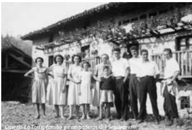
Caserío La Torre, familia y compañeros del Seminario

21 al 26-06-65 Asistió a unas jornadas de Apostolado rural en Burlada y a continuación a un Campamento de Consiliarios en Olazagutia.